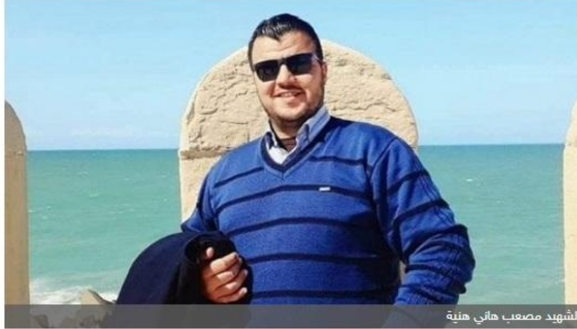
الشهيد مصعب هاني هنية